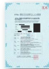
レベル認定証 サンプル